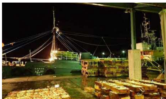
図1 沖合底びき網の水揚げ風景（浜田）

そうしたイメージを一新すべく、沖底漁業者の皆さんはリシップ事業により導入した海水冷却装置を活用して、漁獲物の高鮮度化の取り組みを始められました。当センターでは、主要魚種の中でも特に鮮度落ちが早いミズガレイ(和名:ムシガレイ)を高鮮度化の指標種として、漁業者の皆さんの取組を支援しています。(とびっくす No.76 参照)