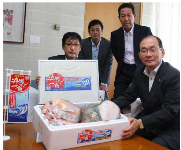
図4 「沖獲れ一番」出荷報告会の様子

今後は、県内のみならず、広島などの隣県や関東・関西方面への流通拡大を視野にPRを進めていくとともに、「沖獲れ一番」の高鮮度を活かした加工品の開発など、新たな利用方法についても調査研究を進めていきたいと思っています。