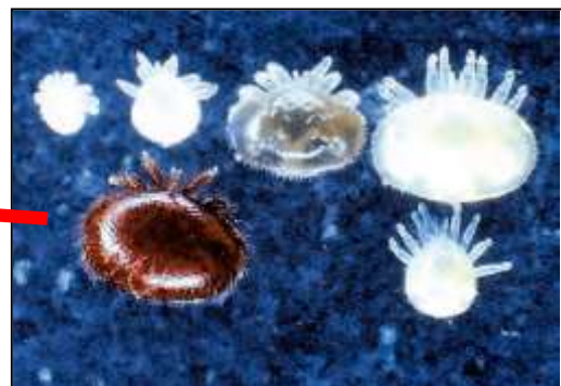
ミツバチヘギイタダニ