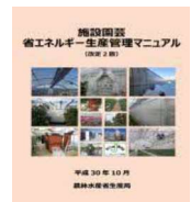
▲省エネマニュアル