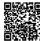
▲省エネ通知のページ QRコード