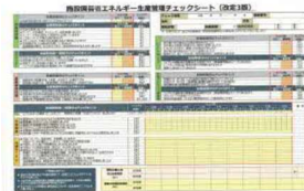
▲省エネチェックシート