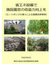
▲省エネで収益力向上を

省エネ機器の導入に加え、被覆の多層化や循環扇の導入、環境制御装置の導入など様々な手段を用いて燃料使用量50%以上削減に取り組みましょう！