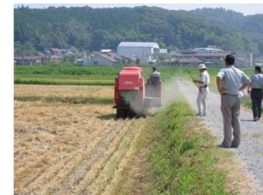
飼料用稲藁の収集作業