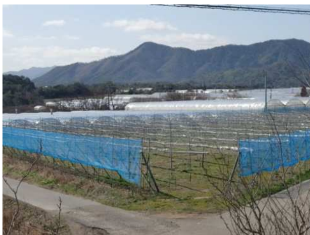
【 益田地区・営農状況 (写真 左: ぶどう、右: ケール) 】