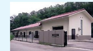
●浜田市(旧金城町)雲城地区の農業集落排水汚水処理施設