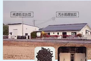
汚泥発酵脱臭機 汚泥発酵分解装置