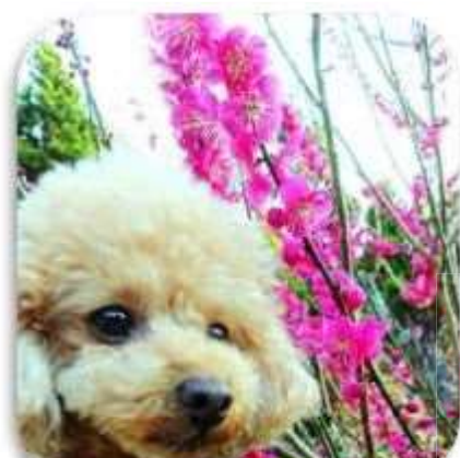
紅梅を愛でるわんこ