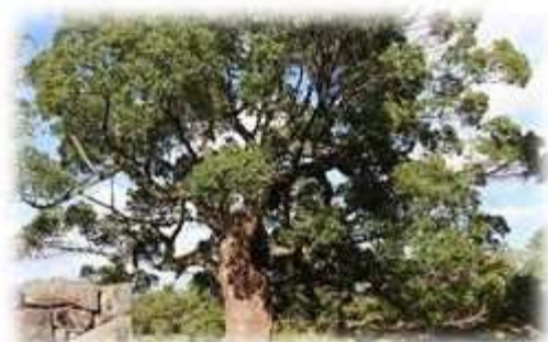
松江城のクスノキ