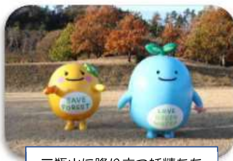
三瓶山に降り立つ妖精たち