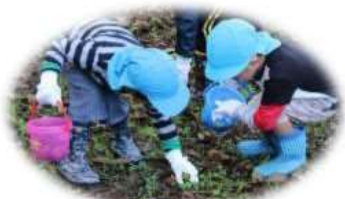
クルミ拾いがんばったよ