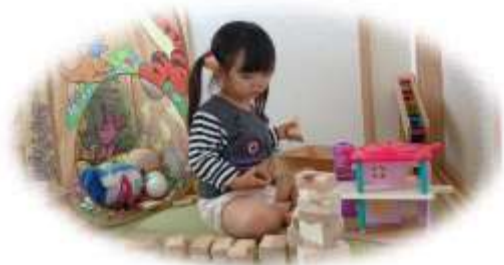
積み木は楽しいね