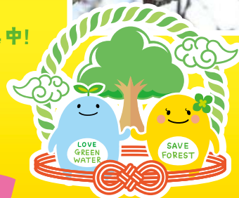
大会シンボルマーク

「樹(木)のある暮らし」をテーマに、身近な自然を切り取った写真を募集中! 応募いただいた写真を使い、大会シンボルマークを モチーフにしたモザイクアートを制作します。 一緒に植樹祭を盛り上げましょう!