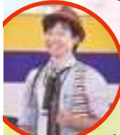
ゆきマジックショー