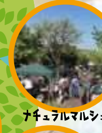
ナチュラルマルシェ