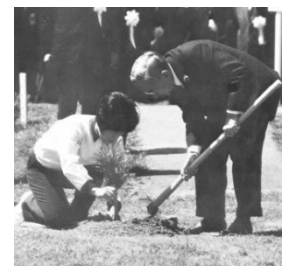
(昭和46年の植樹祭の様子)