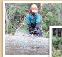
造材・玉伐り作業

隠岐の島の美しい海の源である森林を守るべく、樹木を慈しみ育てていくことを共に考え、汗を流してくださる人材を求めています。