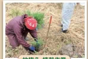
地拵え・植栽作業