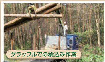
グラブでの積込み作業