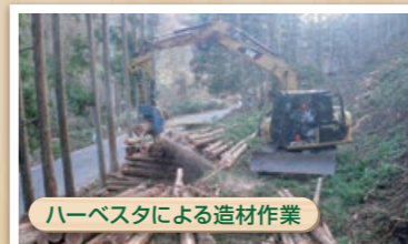
ハーベスタによる造材作業