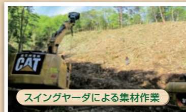
スイングヤーダによる集材作業

誰でも最初はビギナーです。当社では、初めて林業に就業する人であってもやる気のある人はウエルカムです。自然を相手に、森のプロフェッショナルを目指す人を求めています。