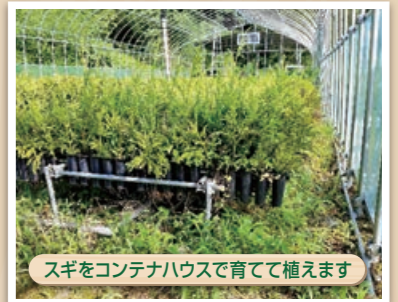
スギをコンテナハウスで育てて植えます