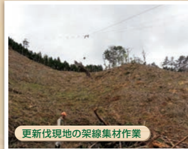
更新伐現地の架線集材作業