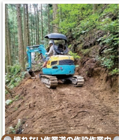
壊れない作業道の作設作業中