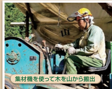
集材機を使って木を山から搬出

社員には県外からのIターン者が多いですが、気さくなメンバーばかりです。元気で明るい職場環境のもと、津和野の山林で、次世代へ繋げる仕事と一緒に汗を流しませんか。