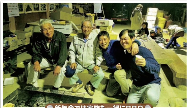
新年会では家族も一緒にBBQ