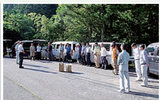
間伐班、森林整備班全員の朝のミーティングの様子