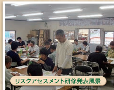
リスクアセスメント研修発表風景