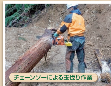
チェーンソーによる玉伐り作業