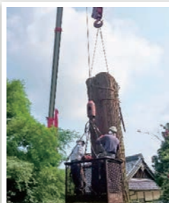
特殊伐採による巨木搬出