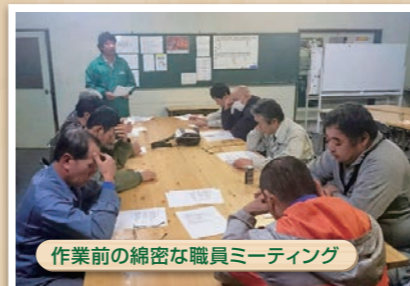
作業前の綿密な職員ミーティング

当社は、本物は感動を与えると信じ、常に時代に吹く風を読み解きながら、さらなる飛躍を目指す人材を求めています。