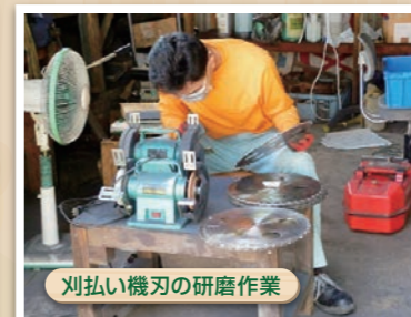
刈払い機刃の研磨作業