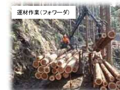
運材作業(フォワーダ)