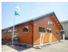
本所新社屋(令和4年3月完成)

私たちは 森林を活かし、森林を育むことを通じて 物心ともに豊かな地域社会の実現に貢献します。