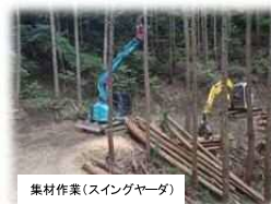
集材作業(スイングヤード)