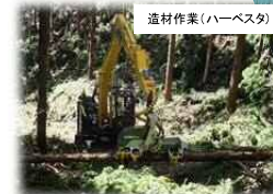
造材作業(ハーベスタ)