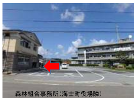
森林組合事務所(海士町役場隣)