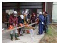
チェーンソーの手入れ指導

また、畜産業も当地域の主要産業であり、森林を活用した放牧地整備も行っています。このように、当組合では、自然の中で個々の力を発揮したい人材を求めています。