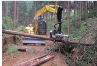
《プロセッサによる枝払・造材作業》