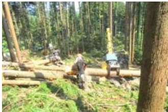
《グラップルによる集材作業》