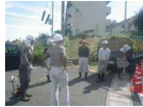
《安全パトロールの状況》