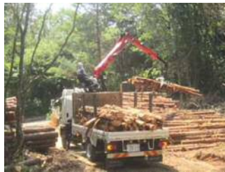
《ヒアブ車による運搬作業》