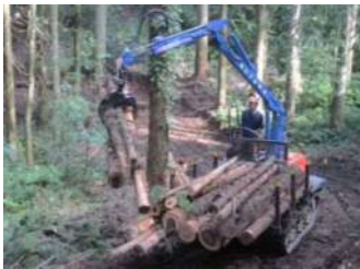
《フォワーダによる搬出作業》