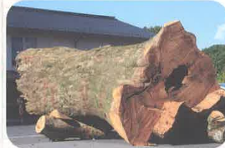
取材協力：株式会社出雲木材市場

市場には時々珍しい丸太が仕入れられることも！この日は幹の太さが車より大きな丸太があったよ。ビックリ！