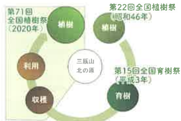
緑の循環のイメージ