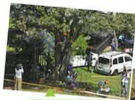
木登り体験イベント

はたらく車の展示では、高所作業車から緑豊かなふるさとの森の景色をお楽しみいただきました。