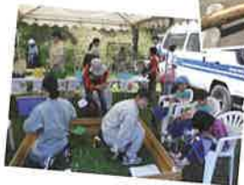
ミニどうぶつえん