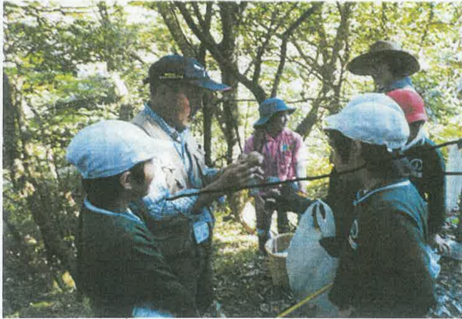
10月11日(火) 益田市立中西小学校 16名(4年生) 森の自然かんさつと自然工作