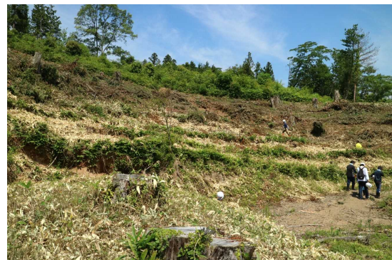
対象森林 (浜田市旭町)