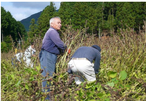
【エゴマの手刈収穫】