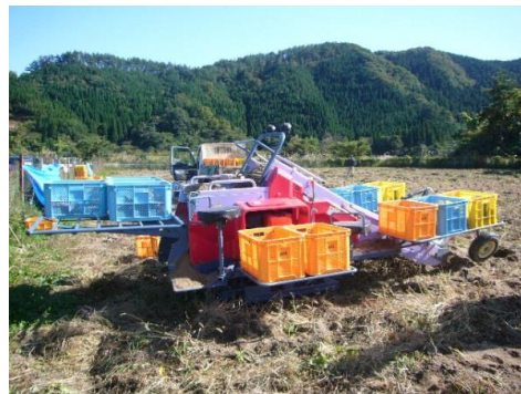
【サツマイモの掘取り機械】