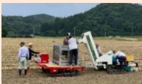
たまねぎ収穫の様子