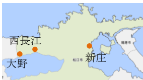
新法人設立のほ場整備地区 (R6年1月時点、設立予定を含む)

新庄、大野、西長江地区において大区画ほ場整備を契機に、担い手確保のための集落営農組織の法人化と高収益作物として水田園芸品目(キャベツ・ミニトマト・たまねぎ)の導入を推進。