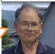
ここにこファーム新庄 津森代表理事組合長