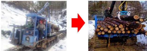
3tフォワーダ 6tフォワーダ フォワーダでの運材作業状況