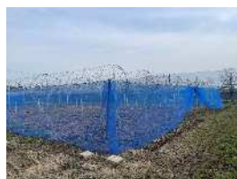
R5年度整備のブドウ研修施設

現在、より多くの研修ニーズに対応すべく、 新たな品目(アスパラガス・ブドウ)での研修計画を策定中。