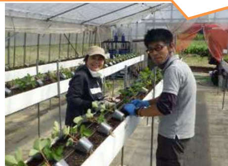
R5年就農した研修生

職員さんとの距離が近く、いつでも相談できることから、安心して栽培に取り組みます。就農後はイチゴを安定して出荷ができるよう頑張ります。