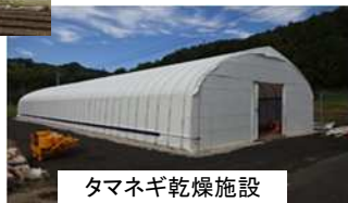
タマネギ乾燥施設