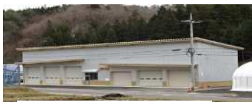
農産物出荷・調製施設

R4年4月、集出荷場所の一元化によるコスト削減を図るため、水稲とタマネギの 農産物出荷調製施設 を整備。さらに、タマネギの品質向上を図るため、R4年9月、 タマネギ乾燥施設を整備 。