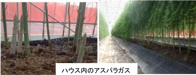
ハウス内のアスパラガス