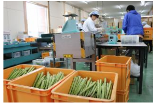
パッキングセンター

R3年には、選別能力が優れる高性能な製選別機を導入し、更なる省力化・高品質化を実現。