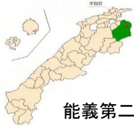
能義第二地区農地整備事業(経営体育成型) (H20~27年度)

【設立】基盤整備を契機にH25年4月設立 【組合員】151人 【経営面積】151ha 【経営内容】水稲134.4ha、大豆16.2ha、麦4.6ha、 なたね2.9ha、そば1.8ha、 キャベツ 3.3ha、 園芸品目(トマト、いちご、 ぶどう)(R4年作付)