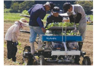
半自動定植機による定植

機械化体系を導入し、作業の効率化を図るとともに病害虫防除、除草対策、定植時のかん水対策等により、収量が3.9t/10a(過去5カ年平均値、作付面積平均約1.8ha)から約4.8t/10a(R3年産、作付面積約3ha)に向上。