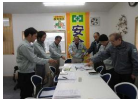
定例業務ミーティング