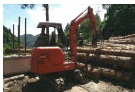
丁寧な重機の取扱