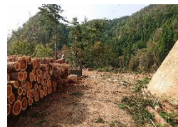
山土場で仕分けられた材