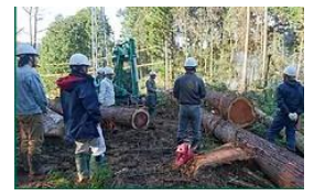
外部講師による採材研修

A材の需要と供給情報を収集し 社内で共有化していくことで、原木販売額の向上に努めていく。