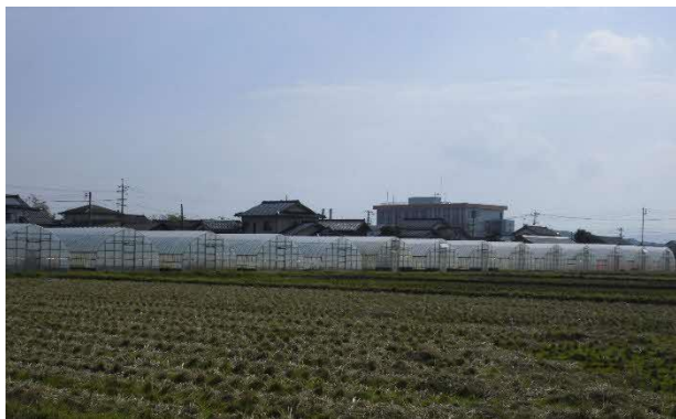
100棟を超えるハウス団地

平均年齢40代の若いメンバーたちが様々な社会経験を農業経営に活かし、赤江・オーガニックファームを全国区にしたいと情熱を注ぐ。