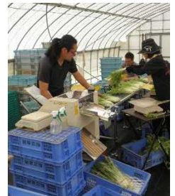
新規就農者の研修

H30年度には研修生2名を受け入れ、2名ともR元年度に認定新規就農者として就農。うち1名は赤江・オーガニックファームに加入し、メンバーが6名に増加。