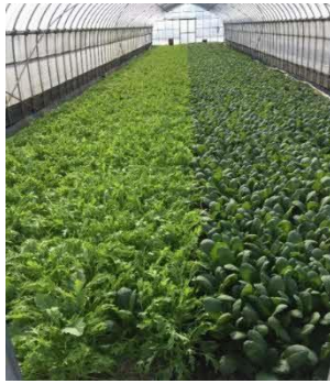
ハウス内の葉物野菜