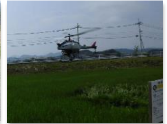
無人ヘリによる追肥