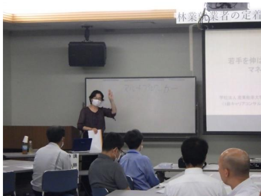
増野講師による講義