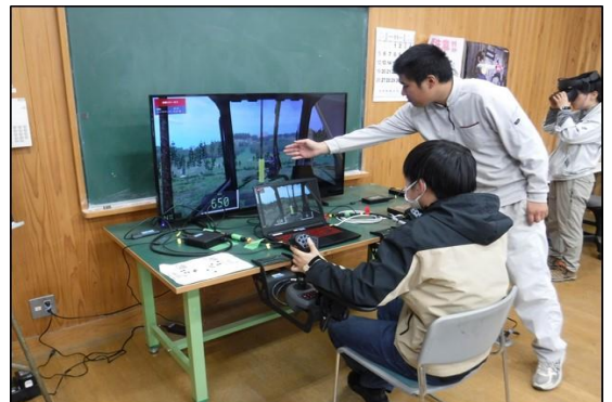
ハーベスタシュミレータ操作体験