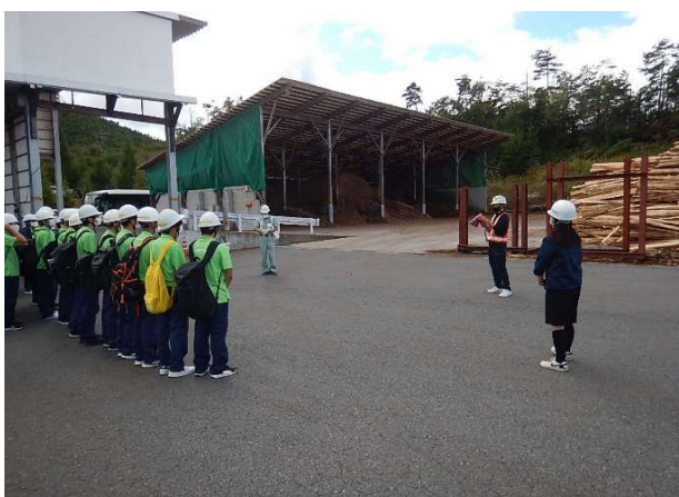
邇摩高校2年生 林業事業体見学