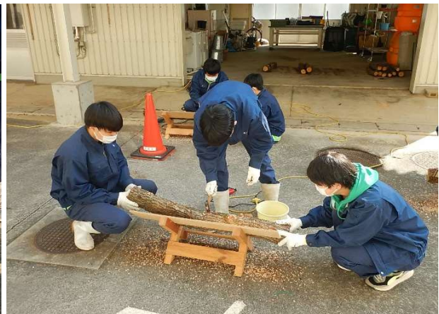
シイタケ原木に シイタケ菌を打ち込む様子