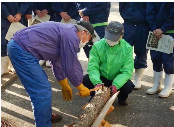
邇摩高校2年生 シイタケ植菌講座

これからも引き続き、林業学習について支援していきたいと思えます。林業講座や実習を通じ、農林大学校への進学や林業事業体へ就職されるなど、島根の林業の担い手として活躍していただけることを大いに期待しています。