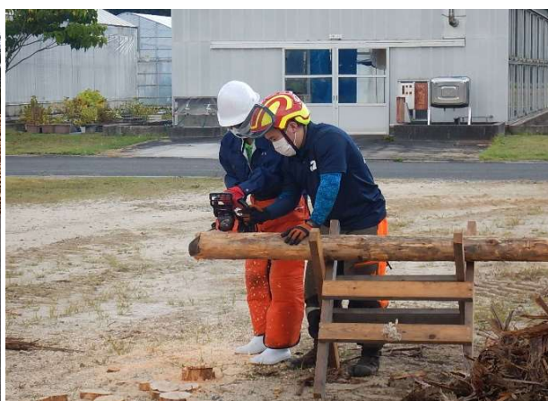
邇摩高校2年生 チェーンソー体験