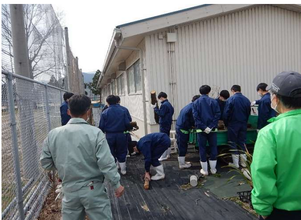
菌糸の活着を図るための仮伏せの様子