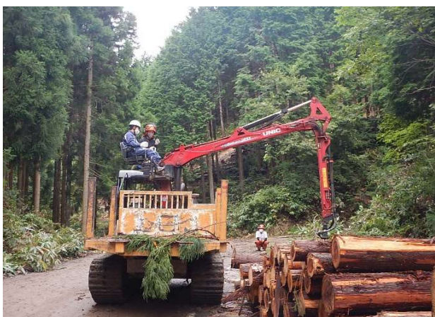
矢上高校2年生 林業機械操縦体験

これからも引き続き、林業教育について支援していきたいと思えます。林業講座や実習を通じ、農林大学校への進学や林業事業体へ就職されるなど、島根の林業の担い手として活躍していただけることを大いに期待しています。