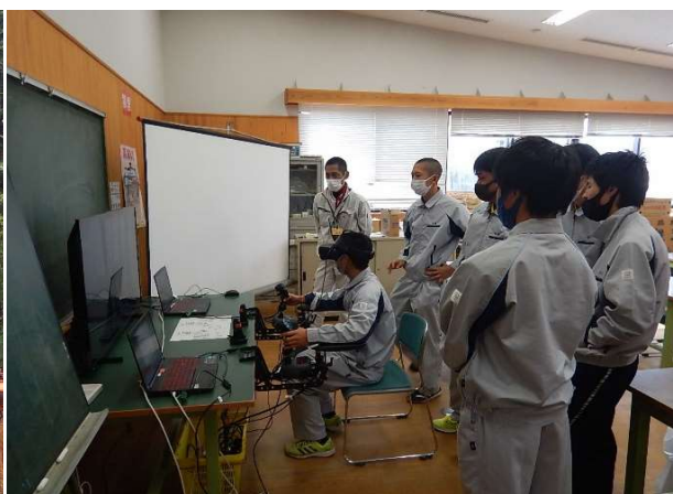
矢上高校1年生 VR操縦体験