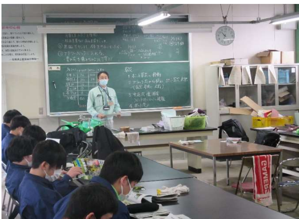
シイタケ栽培についての学習、農林大学校林業科のPR