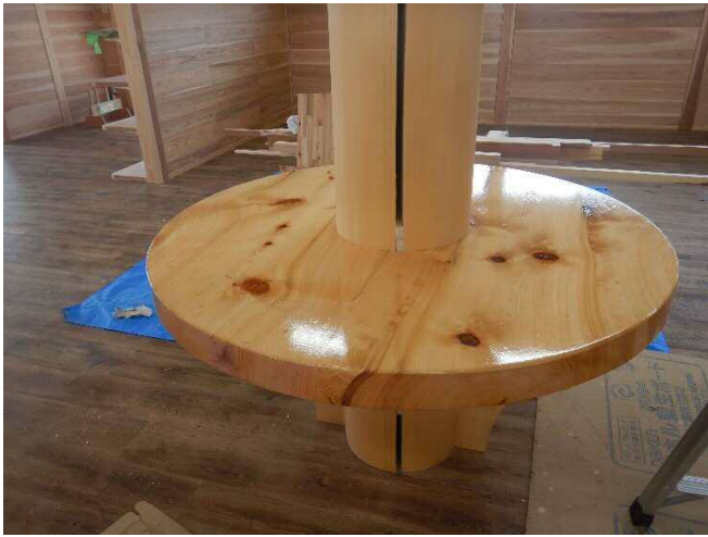
協議用テーブル (ヒノキ)