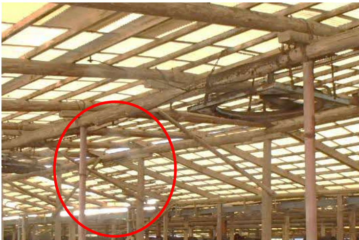
換気扇と霧（ミスト）による暑熱対策の一例