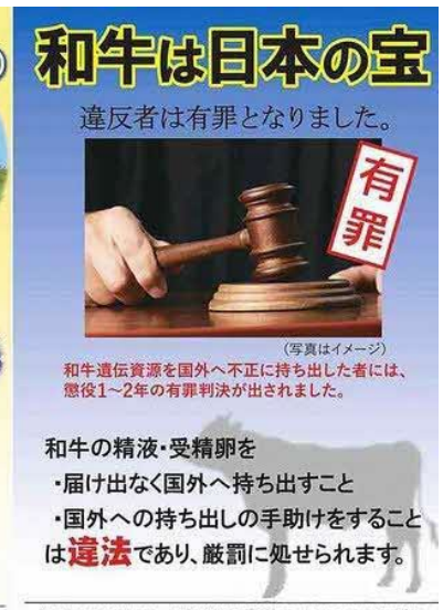
和牛遺伝資源流出防止ポスター (一社)全国肉用牛振興基金協作成