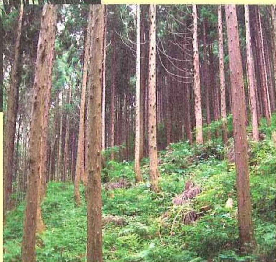
間伐後の森林 林内が明るくなり、下草の生い茂る 健全な森林となった