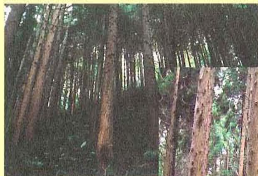
手入れ不足の森林 昼間でも薄暗く、 下草が見られない