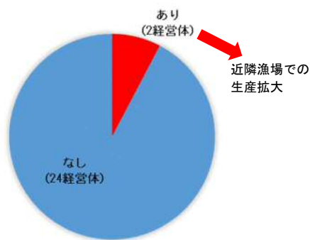
【県内経営体の生産拡大の意向】