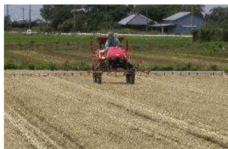
第6図 ブームスプレーヤーによる雑草防除

不耕起栽培では、除草剤により播種前に繁茂している雑草の防除が必要である。非選択性除草剤を播種前に規定量散布する（第6図）。