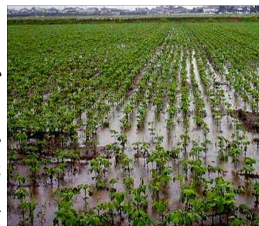
第3図 降雨による滞水

不耕起栽培は、「湿害が発生しない技術」との誤った認識から、基本的な排水対策を省略して栽培する例があり（第3図）、生育不良により雑草が繁茂し大きな減収や栽培放棄といった事例もある（第4図）。中耕培土による除草、排水効果が期待できない不耕起栽培は、弾丸暗きょ、明きょ等の営農排水を慣行栽培と同程度に確実に実施する必要がある。