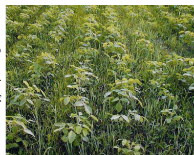
第4図 湿害後の雑草繁茂

密条播栽培は、大豆の早期繁茂によって初期雑草を抑えるのがねらいであるが、大豆播種前の既存雑草及び大豆の草丈を上回る大型雑草等の防除は困難である。したがって、播種前及び生育中期の茎葉処理除草剤を適宜使用する。