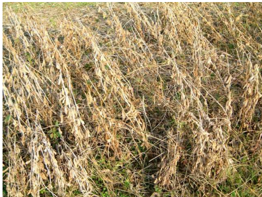
[防除区：完全に落葉]

莢、子実肥大期に適切な害虫防除を怠った場合、落莢、粒肥大阻害により青立ちが発生する(第6図、第3表)。