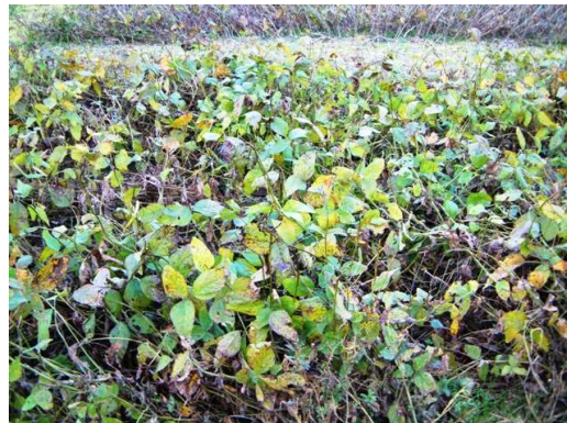
[無防除区：落葉悪く青立ち]