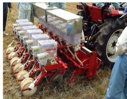
第2図 全農三菱方式不耕起播種機

播種作業において、慣行栽培はロータリー等で耕起、整地し播種を行うのに対して、不耕起栽培は耕起していない圃場に直接播種溝を切り種子を播く方法である（第2図）。また、完全な不耕起ではないが、播種直前まで不耕起で播種時に軽く浅耕しながら播種する半不耕起と、播種条の部分のみ10cm程度の中耕起する部分耕も広義の不耕起栽培としてここでは取り扱う。