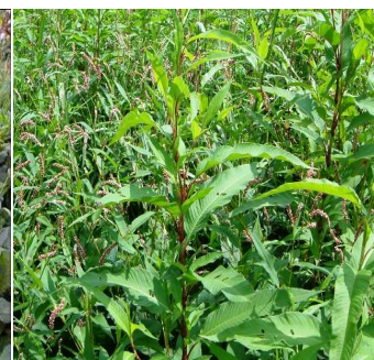
第8図 オオイヌタデ