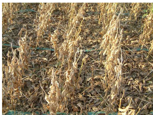
[適湿区：完全に落葉]

生育初期の湿害は根域が浅くなり、開花～着莢期の夏期高温乾燥期に水分不足が起こりやすく、落花、落莢の増加により青立ちが発生する(第7図、第4表)。