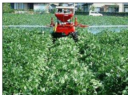
第9図 ブームスプレーヤー防除

密条播栽培は、畦幅が狭く茎葉が繁茂するため、畦間が分かりづらいことから、ブームスプレーヤーで防除を行う場合は、作業機の踏みつけや巻き込みによる損傷が生じやすい(第9図)。対策として、播種時や繁茂量の少ない生育期除草剤の散布時に作業機の走行路を設定し、以後その走行路を継続して利用すれば、子実害虫防除の作業がしやすく、損傷も少なくなる。