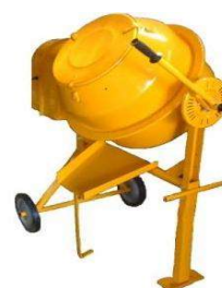
第1図 種子消毒剤用ミキサー

紫斑病防除のために種子の消毒を行う。ハト類による発芽時食害を回避する効果のある薬剤、殺虫効果のある薬剤もある。