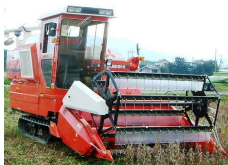
第8図 コンバイン収穫

成熟期は、ほ場全体のほとんどが落葉し、茎や莢が変色し軽く振ると子実がカラカラ音をたてる時期である。収穫が早過ぎると茎汁等による汚損粒や破碎粒が発生しやすく、遅れると自然裂莢による収穫ロスやしわ粒が多くなり、降雨、積雪により機械作業日、時間が限定されるので、品質と収量を向上させるためには、適期を逃さず収穫することが必要である。コンバイン収穫前には、必ず青立ち株や大型雑草を除去し、汚損粒の発生防止に努める。成熟当初の茎水分は70%前後と高く、そのままでは茎の汁により汚損粒が多発するので、茎水分が40～50%以下（手で折るとポキッと折れる状態）になった時期が刈り取り適期である。刈取りは、朝露が完全に乾く午前10時～午後5時の日中に行うようにする。