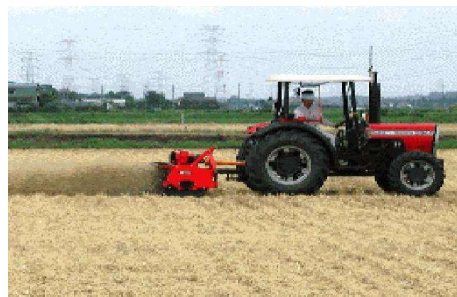
第5図 フレールモアによる麦稈細断

高い刈り株や多量の麦稈は、播種作業の支障になり、大豆の徒長や出芽不良を起こしたり、麦わらの下になった雑草の除草が困難となるので、フレールモア等を用いて細断・拡散を行う（第5図）。