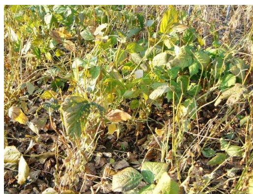
[初期過湿+開花期過乾処理区：落葉悪く青立ち]