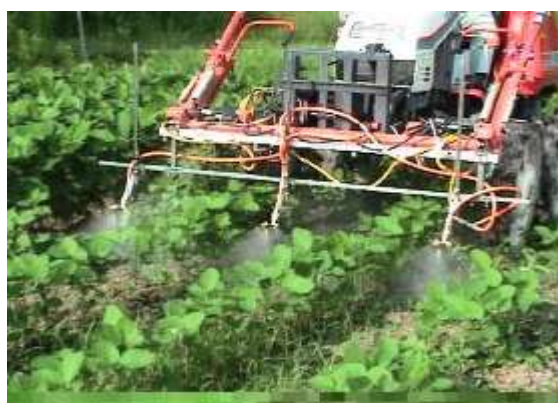
第4図 茎葉処理剤畦間散布