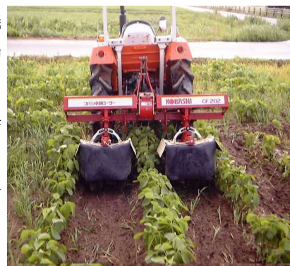
第5図 トラクター用中耕機

中耕・培土は雑草防除、土壌の通気改善、排水性の向上による湿害防止、不定根発達の促進による干ばつ回避、倒伏軽減など多くの効果があり、大豆の安定多収栽培には欠かすことのできない作業である（第5図）。中耕・培土は2回程度行う。管理機やトラクター装着カルチで1回目は第2複葉展開期（播種後約20～25日）に行い、子葉節まで培土、2回目は第5複葉展開期（播種後約30～35日）に行い、第1複葉節まで培土する。収穫機の作業性を考え、最終培土の畦高さを20cm程度にとどめ、均一にする。また、2回目の培土は適期が遅れると大豆を傷めて逆効果となるので、開花始めまでに終える。麦跡等の晩播栽培（6月下旬～7月上旬）では開花までの期間が短くなるので、第3～4複葉展開期（播種後約25～30日）に1回行う。