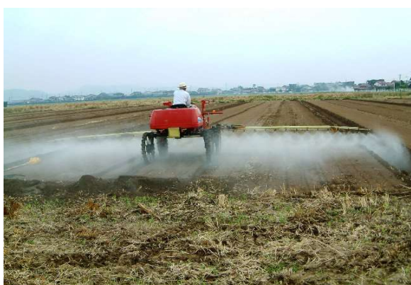
第3図 土壌処理剤散布

大豆の雑草防除は播種直後の土壌処理剤と中耕培土の組み合わせによって行うのが基本である（第3図）。また、既存雑草が多い場合は、播種前、耕起前に使用可能な茎葉処理剤もある（第4図）。土壌処理剤は碎土が良好で土壌が適度に湿っているときに最も効果が高くなる。土壌水分が多い場合や砂質土壌では葉害が出やすいので薬量、希釈水量共に基準量の少ない方へ、逆に土壌が乾燥している場合は基準量の多い方へ合わせる。また、土壌処理剤の持続期間は20～30日程度であり、その後中耕培土を行うが、作業が梅雨期のため適期を逃した場合は、イネ科・広葉それぞれに登録のある選択性茎葉処理剤を使用する。イヌホオズキ、帰化アサガオ類などが占有している圃場では非選択性茎葉処理剤を使用する。この場合、大豆に飛散しないように畦間に局所散布する。