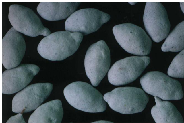
第 12-3 図 コーティング種子