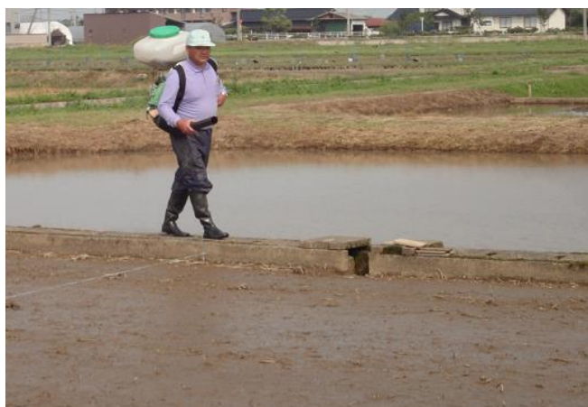
第12-5図 動力散布機を使用した播種作業