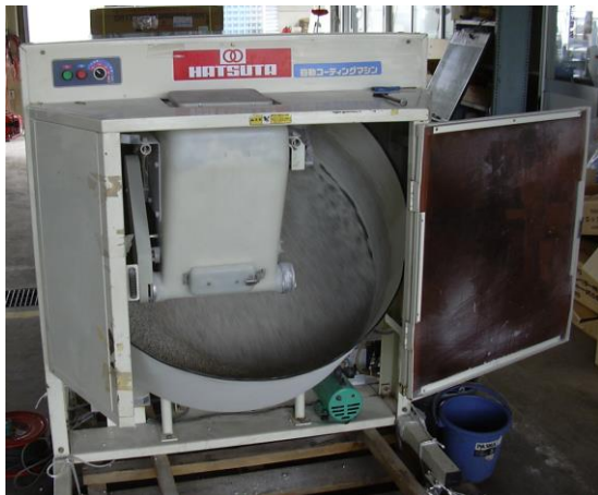
第 12-1 図 自動コーティングマシンを使用したコーティング作業