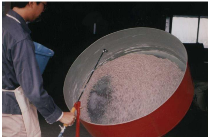
第 12-2 図 コーティングマシンを使用したコーティング作業