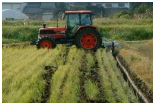
第2図 弾丸暗きょ(額縁明きょの底面から施工)