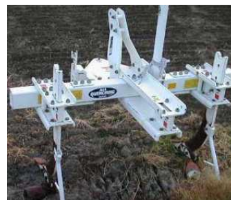
第3図 弾丸暗きょ機

サブソイラで補助暗きょを入れて地下透水性の強化を図る。設置間隔、深さ等はほ場条件により異なるが、弾丸暗きょの場合は、本暗きょに直交して2～3m 間隔、深さ 30 cm程度に入れる方法が一般的である(第2図)。いずれも額縁明きょと本暗きょの疎水材層に達するように深さを設定する。作業は、ほ場の表層が乾燥している時を見計らって行う。