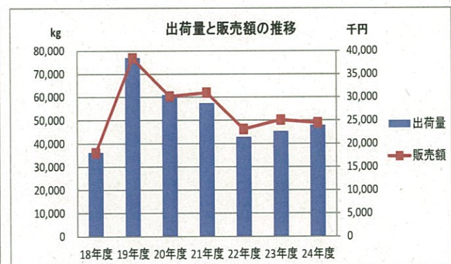
図2 ‘あすっこ’出荷量と販売価格の年次推移