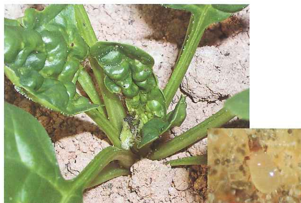
図1 ホウレンソウケナガコナダニ成虫とホウレンソウの被害

ホウレンソウを加害するコナダニ類は数種類います。その主要種であるホウレンソウケナガコナダニは本来土壤中に生息する有機物分解者ですが、近年、農薬や化学肥料を減らし、土作りに有機質資材を積極的に活用するいわゆる環境保全型農業において、害虫として認識されるようになってきました。そこでその防除対策を講じるため、本種の発生生態ならびに播種前の土壤中密度と被害との関係を明らかにしました。