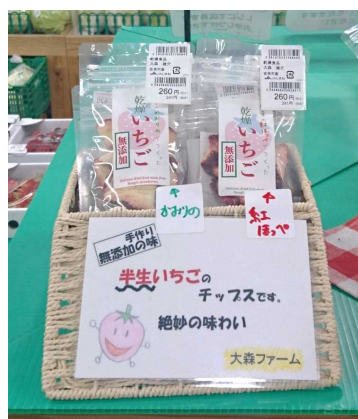
実際に店頭で置かれた参加者のPOP