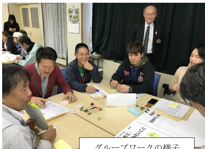
グループワークの様子

当会を来年度も継続して開催するとともに、今回グループワークで発表された提案内容が1つでも実現できるよう関係機関で支援していく予定です。