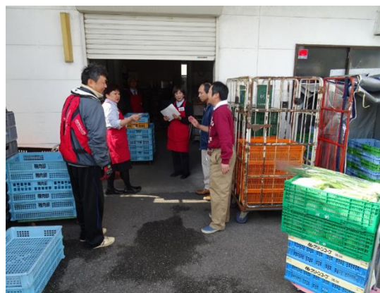
共同出荷することになったことを店舗へ説明