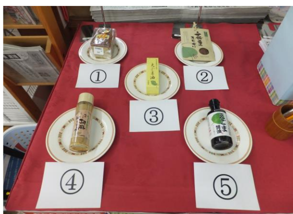
写真：エントリー商品（A産直市）

今後、普及部では、選んだ理由等を整理し、商品のブラッシュアップにつなげるとともに、投票者のデータ分析（年代、住所等）を行い、今後の特産品開発や産直市運営に活かしていきたいと考えています。