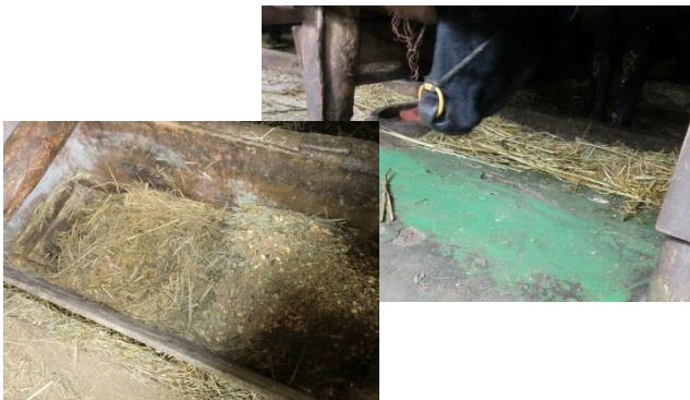
利用者の牛舎の様子

今後は、利用者からの意見をより多く収集するとともに、稲WCSの生産者に対して、早生・晩生品種それぞれの栽培実態調査も併せて行い、また稲WCSの更なる品質向上のために出雲版の栽培暦の作成も計画しており、今まで以上関係機関一体となって取り組むこととしています。